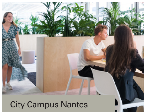
City Campus Nantes