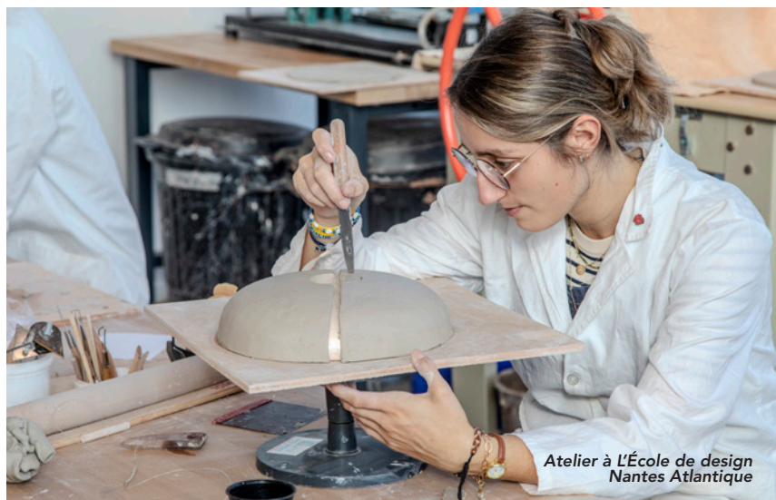
Atelier à L'École de design Nantes Atlantique