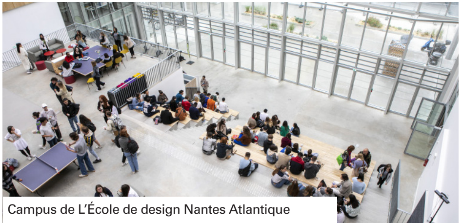
Campus de L'École de design Nantes Atlantique