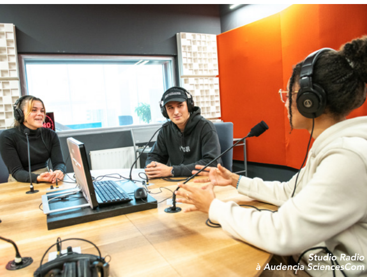
Studio Radio à Audencia SciencesCom